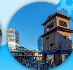
ตลาดโบราณ เซ็นยะคุบันโร โทโยสุ