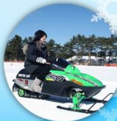
กิจกรรม ขับสโนว์โมบิลชมวิวฟูจิ