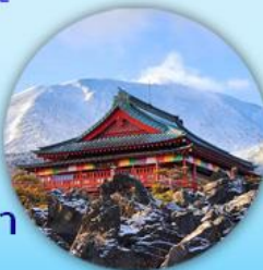
หุบเขา โอนิโอะซิดาชิ

นาคาโตะ มัตสึโมโตะ กุมมะ คุสัทซึ ยามานาชิ โตเกียว นั่งกระเช้าชมวิวฮาคุบะอิวาทากะ เมืองเก่าคาวาโกเอะ ศาลเจ้าอิทากะ กิจกรรม วาดารุมะ เก็บสตอเบอร์รี่ ปราสาทมัตสึโมโตะ วัดโกโตะคุจิ ช้อปปิ้งคาร์ยูซาว่าเอาร์ท์เล็ท ชินจุกุ กินซ่า