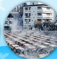
เมืองคุสัทซึ ชมยูบาคาตากะ