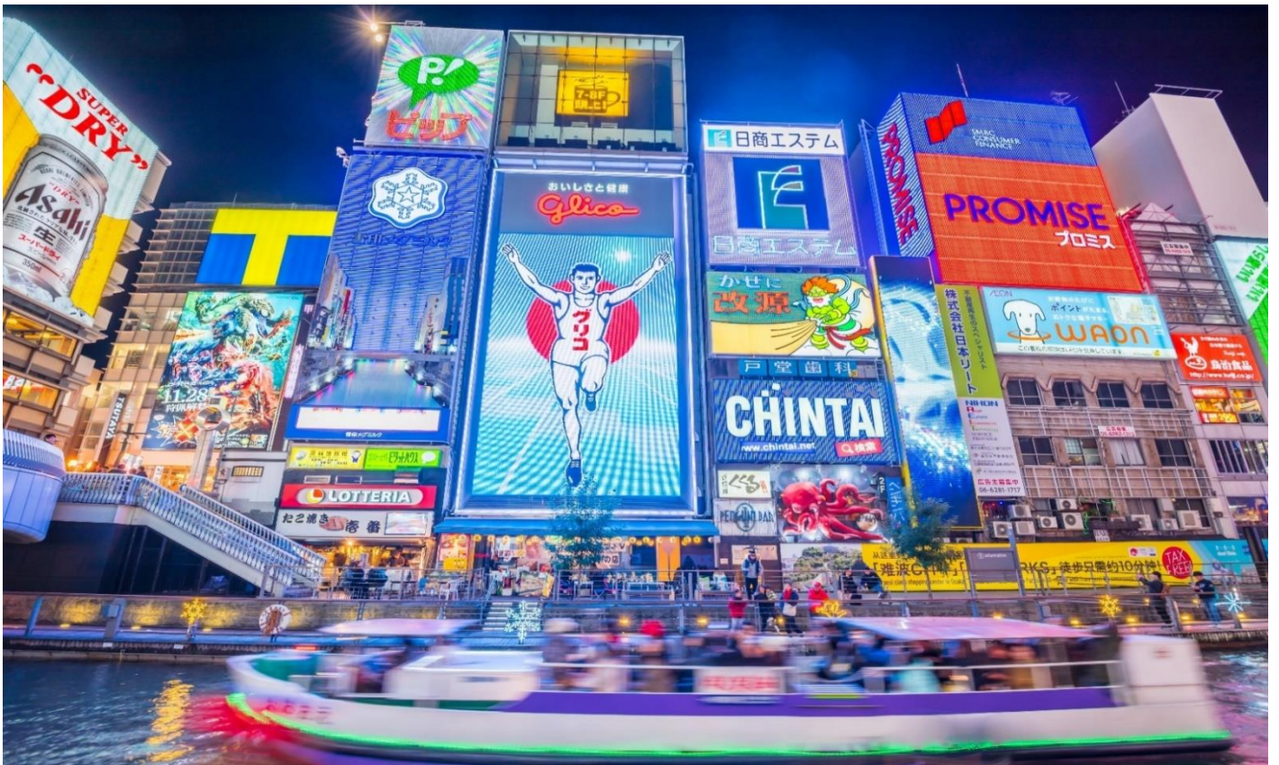
คำ อีระอาหารตามอัยาศัยเพื่อสะดวกแก่การช้อปั้ง ที่พัค SUN WHITE HOTEL, OSAKA หรือเทียบเท่า