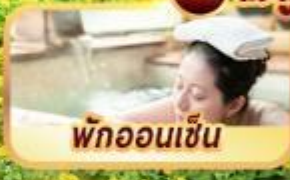
พักผ่อนเซ็น