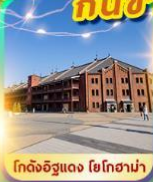
โกดังอิฐแดง โยโกฮาม่า