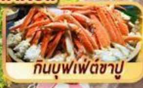
กินบุฟเฟ่ต์ชาบู