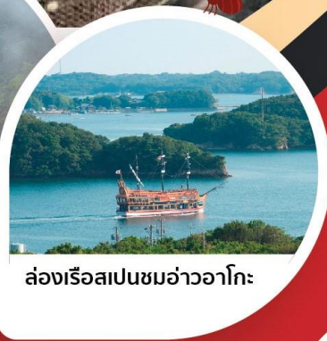
ล่องเรือสเปนชมอ่าวอาโกะ