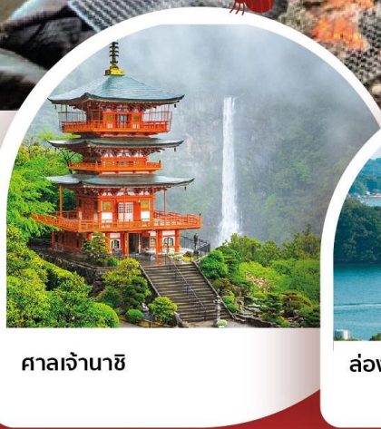
ศาลเจ้านาชิ