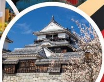
ปราสาทมัตสึยามะ