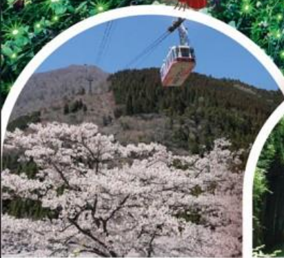
นั่งกระเช้าลอยฟ้าเบปุ