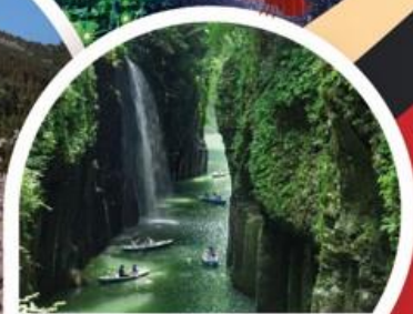
ช่องเขาทาคาชิโ