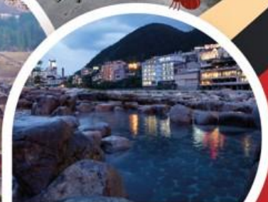
เกาะโระ ออนเซ็น