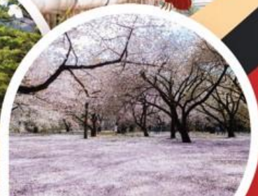
สวนชินจูกุเจียวอน (ชมซากุระ)