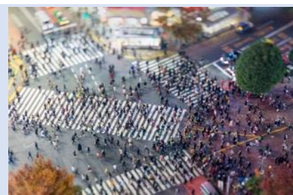
ย่านชิบูย่า — แหล่งรวมวัยรุ่น แฟชั่น

ทะเลสาบคาวากูจิโกะ ในฤดูหนาวที่นี้คือสวรรค์ที่งดงามสำหรับผู้หลงใหลในความเงียบสงบและความงามของธรรมชาติ เมื่อหิมะปกคลุมภูเขาไฟฟูจิและพื้นที่โดยรอบ ทิวทัศน์ที่นี้จะเปลี่ยนเป็นภาพที่งดงามราวกับออกมาจากภาพวาด หน้าหนาวที่นี้เต็มไปด้วยบรรยากาศที่โรแมนติก จากนั้น...นำพาทุกท่านสู่ DUTY FREE ที่ให้ทุกท่านได้เลือกซื้อหรือจะเลือกซื้อเป็นของขวัญได้ตามอัธยาศัย โดยสินค้าที่แนะนำ เช่น วิตามินบำรุงสุขภาพ สรรพคุณหลากหลายชนิด และสินค้าชื่อดังของญี่ปุ่น โคมไฟหน้าถ่านหินภูเขาไฟ และเครื่องสำอางค์ Special Set และอื่นๆ อีกมากมาย จากนั้นขอพาทุกท่านเข้าสู่...กรุงโตเกียว และกันที่ ย่านชิบูย่า (SHIBUYA) หนึ่งในจุดหมายที่ห้ามพลาดสำหรับผู้รักแฟชั่นและการช้อปปิ้งแสนหรูของชิบูย่าไม่เพียงแต่เป็นที่รู้จักจาก "ห้าแยกชิบูย่า" ที่มีชื่อเสียง ที่นี้ยังมีร้าน POP MART ที่เอาใจสายจุ่มอีกด้วย นอกจากนี้ยังมีร้านค้าหรูหราและร้านแฟชั่นที่ทันสมัยมากมาย เช่น SHIBUYA 109 และ PARCO รวมไปถึงคาเฟ่ และร้านอาหารที่น่าสนใจอีกมากมายที่คุณสามารถแวะไปพักผ่อนระหว่างการช้อปปิ้ง และให้ทุกท่านได้เพลิดเพลิน เรา อีสระอาหารเย็น เพื่อให้ทุกท่านได้เลือกรับประทานอาหารได้ตามอัธยาศัย