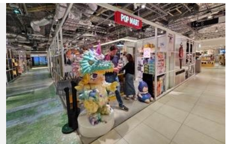
POP MART สายจุ่มถูกใจสิ่งนี้ !