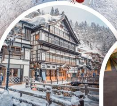
กินชงออนเซ็น