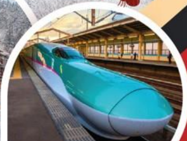
นั่งรถไฟชินคันเซ็น