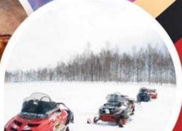
ลานสกีซึคิโซ โนะโอะกะ