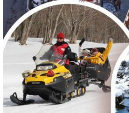
ลานสกีมินาคามิ