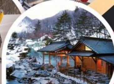
การาคาวะ ออนเซ็น