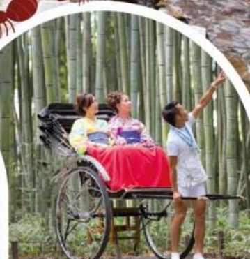
นั่งรถลากที่อาราชิยาม่า

📶 Wifi on bus 💧 บริการน้ำดื่ม 👤 10 คน ออกเดินทาง