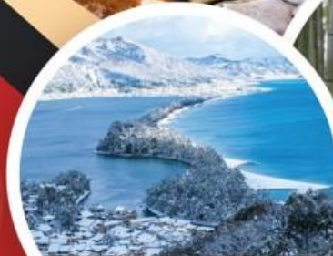
จุดชมวิวอามาโนะฮาซิดาเตะ