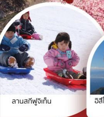
ลานสกีฟูจิเท็น