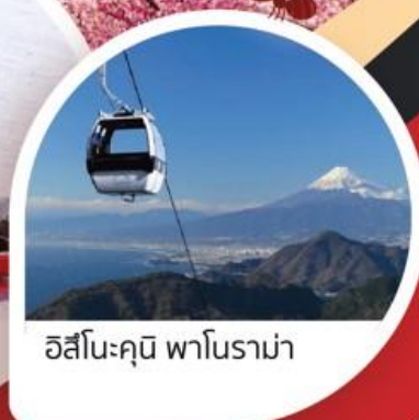
อิสึโนะคุนิ พาโนรามา