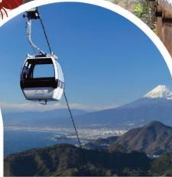
นั่งกระเช้าลอยฟ้า อิซุพานาโระมา

📶 Wifi on bus 🩸 บริการน้ำดื่ม 👤 10 คน ออกเดินทาง