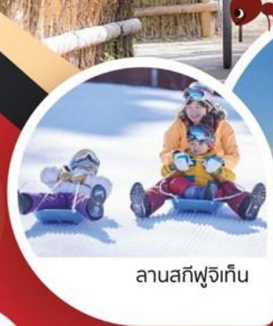
ลานสกีฟูจิเกิน