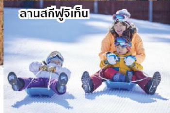
ลานสกีฟูจิเกิน