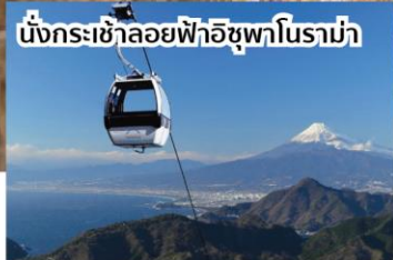
นั่งกระเช้าลอยฟ้าอิชูฟานาโระมา