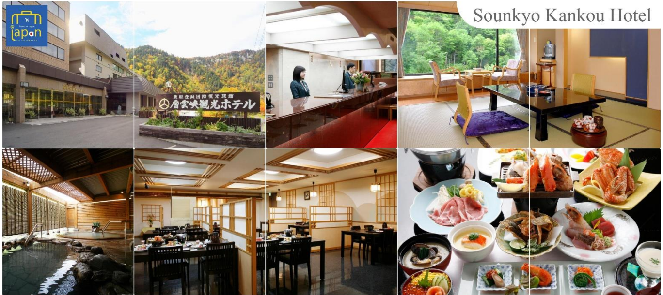
Sounkyo Kankou Hotel

หลังอาหารให้ท่านได้ผ่อนคลายกับการแช่น้ำแร่ธรรมชาติ เชื่อว่าถ้าได้แช่น้ำแร่แล้ว จะทำให้ ผิวพรรณสวยงามและช่วยให้ระบบหมุนเวียนโลหิตดีขึ้น