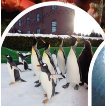
นิกซ์มารีนพาร์ค