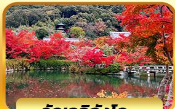
วัดเออิทังโด