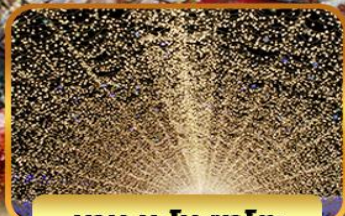
นาบะนะโนะซาโตะ