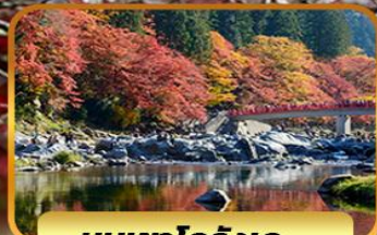
หุบเขาโครังเค