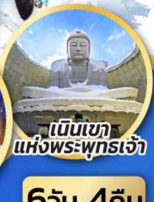
เป็นเขา แห่งพระพุทธรเจ้า

ชมความน่ารักของสัตว์ต่างๆ ที่พิพิธภัณฑ์สัตว์น้ำโอตารุ