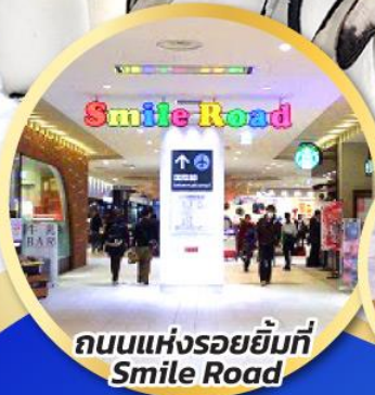
ถนนแห่งรอยยิ้มที่ Smile Road