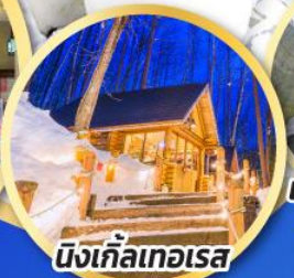
นิงเกิ้ลเทอเรส