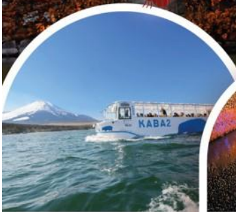
รถสะเทินน้ำสะเทินบก