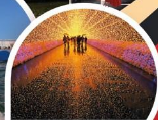
สวนประดับไฟ นานานาโนะซาโตะ

โอซาก้า ◦ นารา ◦ เกียวโต ◦ อาราชิยาม่า ◦ นาโกย่า ◦ ยามาฮากะ ◦ โตเกียว