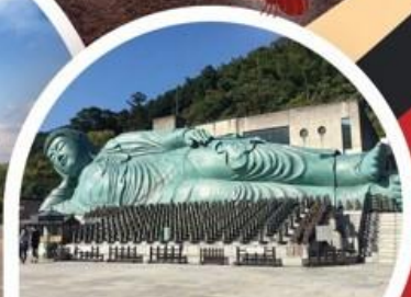
วัดนันโซอิน