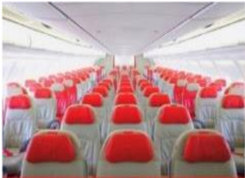
เครื่องลำใหญ่ 377 ที่นั่ง

ตัวเครื่องบินเป็นตัวกรู๊ปสำหรับคณะทัวร์ ระบบของสายการบินจะทำการแรนดอมที่นั่ง ซึ่งไม่สามารถล็อกหรือเลือกกระบูกที่นั่งได้ หากลูกค้าต้องการเลือกกระบูกที่นั่ง ทางสายการบินมีบริการอัพเกรดที่นั่ง (ค่าบริการเป็นไปตามที่สายการบินกำหนด)