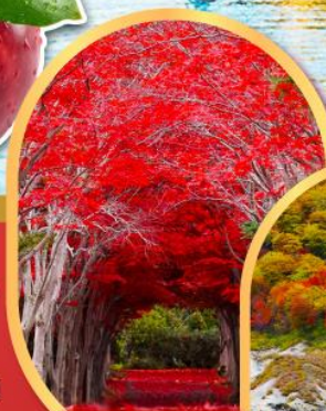
อุโมงค์เมเปิ้ลแดง ณ สวนลับฮิราโอะ