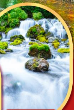
สัมผัสน้ำแร่ธรรมชาติ ณ สวนฟูทาคิชิ