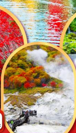
หุบเขานรกจิกุกุคานี