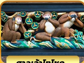
ศาลเจ้าโทโฮกุ