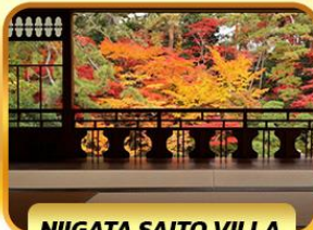
NIIGATA SAITO VILLA