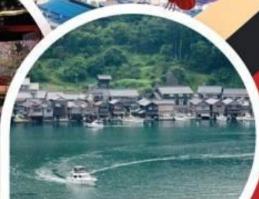
ล่องเรืออิเนะ