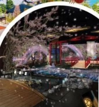
พิพิธภัณฑ์สัตว์น้ำอาโตะ