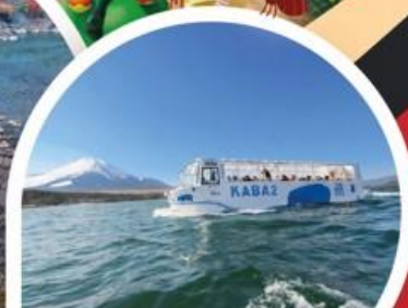
รถสะเทินน้ำสะเทินบก