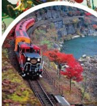
รถไฟอาราชิม่า