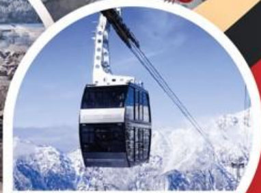
นั่งกระเช้าชินโอะตะกะ