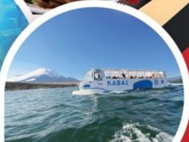
รถบัสสะเท็นน้ำสะเท็นบก