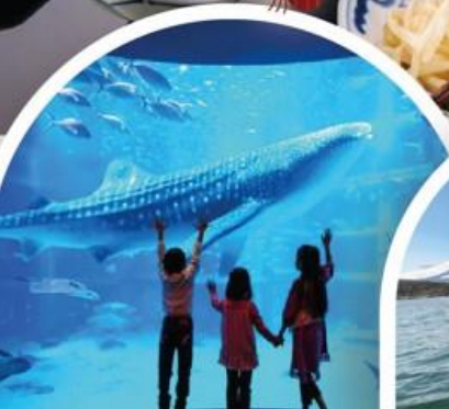
พิพิธภัณฑ์สัตว์โคชูคัง