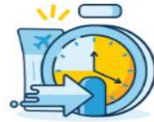
Check-in Time Limit