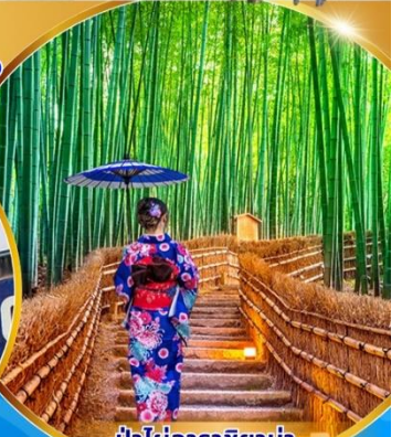
ปาไฟอราชิยาม่า