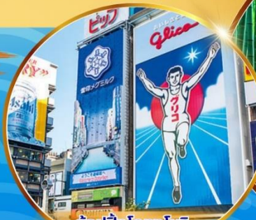
ซูปปังโดทงโบรี