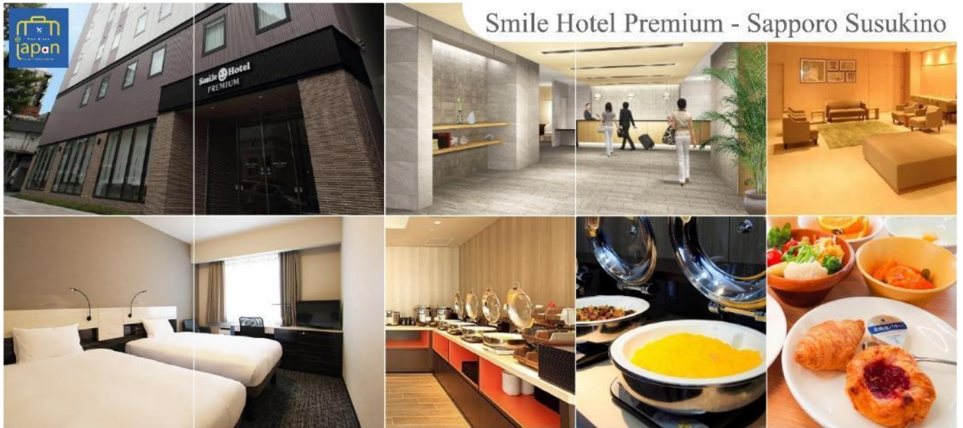
Smile Hotel Premium - Sapporo Susukino

รับประทานอาหารเย็น ณ ภัตตาคาร (7) พิเศษ!!! เมนู นูฟเฟดชาบู + ชาบู SMILE HOTEL PREMIUM - SAPPORO SUSUKINO หรือเทียบเท่าระดับเดียวกัน