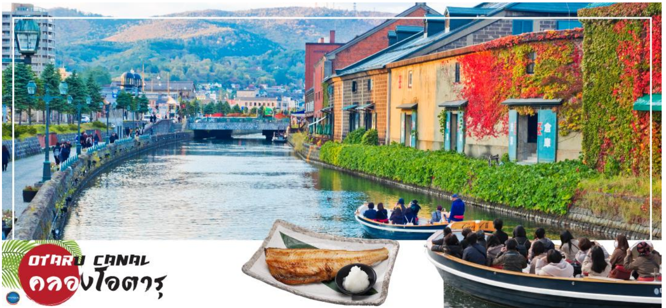
OTARU CANAL คลองโอตารุ

เมืองซัปโปโร – ดิวตี้ฟรี – เมืองโอตารุ – คลองโอตารุ – พิพิธภัณฑ์กอลองดนตรี – เมืองซัปโปโร – หมู่บ้านช็อคโกแลต อิชियะ (ด้านนอก) – ซ้อปิ้งทานุกิโคจิ