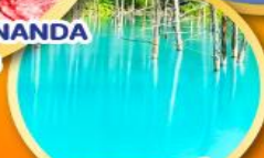
บลูพอนด์ (บ่อน้ำสีฟ้า)