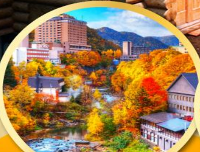
เมืองโจเซจิ