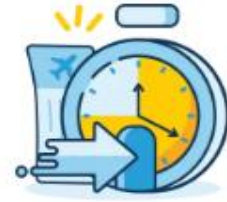
Check-in Time Limit