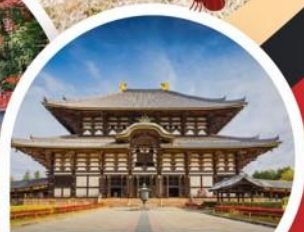
วัดโทไดจิ

Wifi on bus บริการน้ำดื่ม 10 คน ออกเดินทาง