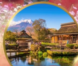
หมู่บ้านโอชิโนะอัทโก