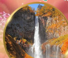
น้ำตกเคกอน