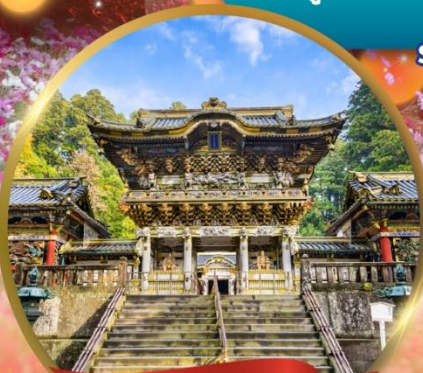
ศาลเจ้านิกโก โทโชกุ