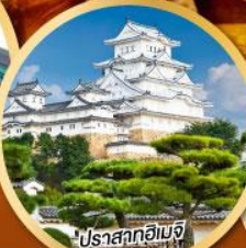
ปราสาทอิมิจิ