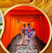
ศาลเจ้า ฟุชิมิ อินาริ