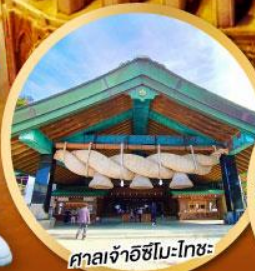
ศาลเจ้าอิชิโมะโทะ