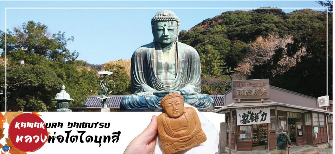
KAMAKURA DAIBUTSU หลวงพ่อดาโบทสี

วันที่สอง ท่าอากาศยานนานาชาตินาริตะ – เมืองนาริตะ – เมืองคามาคุระ – ศาลเจ้าสี่รุเงโอะกะสะจิมัง – ถนนโคมาจิโดริ – พระใหญ่ไดบุทสี คามาคุระ – เมืองยามานาชิ – หมู่บ้านโอชิโนะสั๊กไก – ออนเซ็น + ชาบูยักษ์