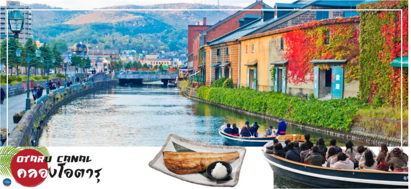
OTARU CANAL คลองโอตารุ