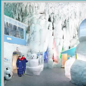
"KAMIKAWA ICE PAVILLION"