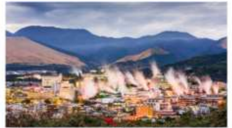
เมืองหลวงออนเซ็นเบปปุ