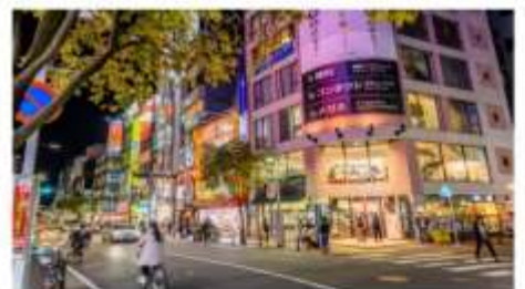
ย่านเท็นจิน