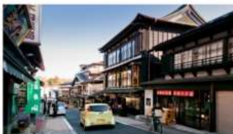
ถนนช้อปปิ้งโอโมเตะซันโด