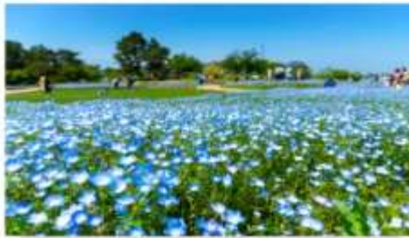
สวนดอกไม้ริมทะเล