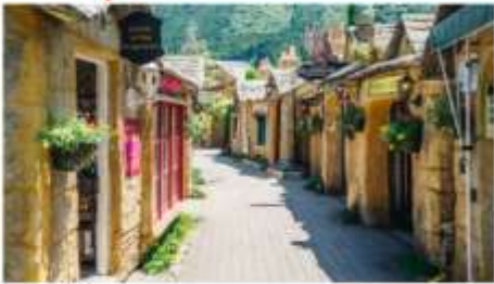
หมู่บ้านยูฟูอิน