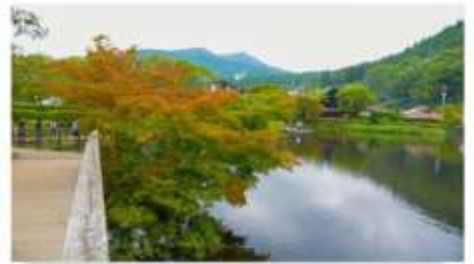
ทะเลสาบคินริน