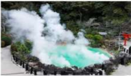
บ่อนรททะเลเดือด