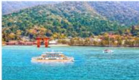
ล่องเรือสู่เกาะมียาจิมะ