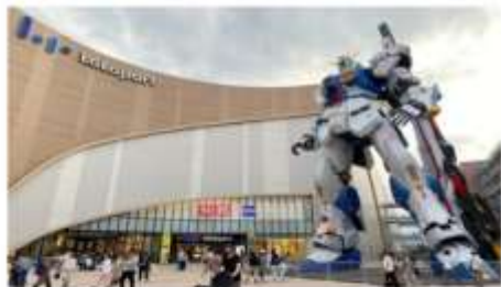
กันดั้มพาร์ค ลาสาพอร์ต