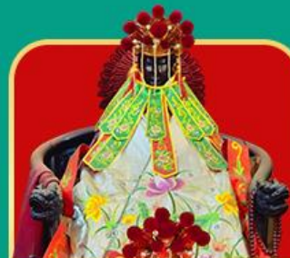
เจ้าแม่กวนอิมสองอ่า