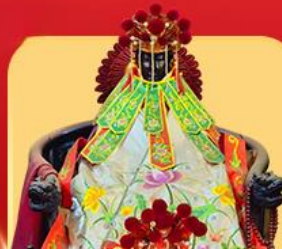
เจ้าแม่กวนอิมสองอ้า