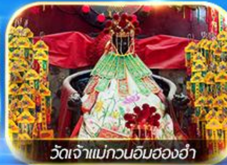
วัดเจ้าแม่กวนอิมสองฮา