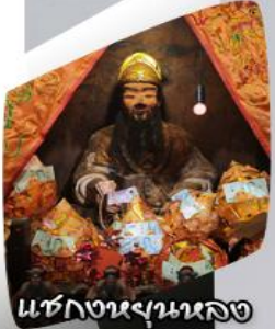
แซกงหยุนหลง