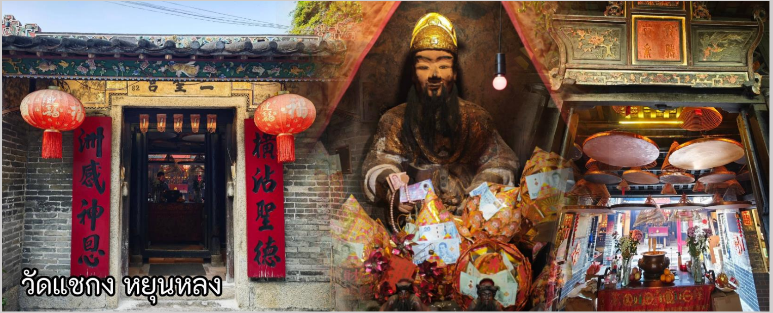
วัดแซกง หยุนหลง

หลังจากนั้นเดินทางสู่เขตหยุนหลง ซึ่งเป็นที่ตั้งขององค์แซกงองค์ดั้งเดิมกว่า 600 ปี I Shing Temple ซึ่งในมือถือขวานเป็นอาวุธ