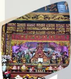
วัดเอ็งเจียง+เทพนาคา

รหัสโปรแกรม : 41407 (กรุณาแจ้งรหัสโปรแกรมทุกครั้งที่สอบถาม)