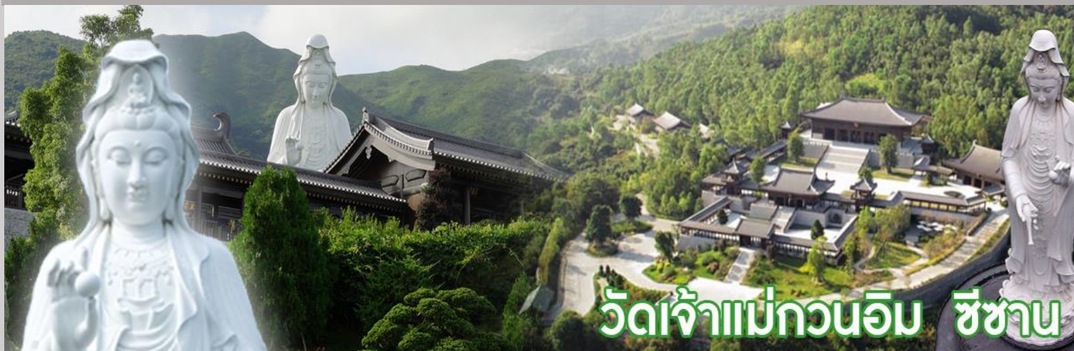
วัดเจ้าแม่กวนอิม ชีซาน

วัดชีซาน หลายคนที่เคยไปเที่ยวฮ่องกงมาแล้ว อาจจะยังไม่เคยเยือนวัดชีซาน หรือ Tsz Shan Monastery เป็นวัดที่มีเจ้าแม่กวนอิมองค์ใหญ่เป็นอันดับสองของโลก มีความสูงถึง 76 เมตร ตั้งอยู่บนเนื้อที่กว่า 29 ไร่ ในเกาะฮ่องกง โดยมีนาย ลี กาชิง มหาเศรษฐีชื่อดังของฮ่องกง บริจาคเงินสร้างวัดถึง 193 ล้านดอลลาร์เลยทีเดียว