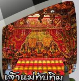
เจ้าแม่ทับทิม Joss House Bay