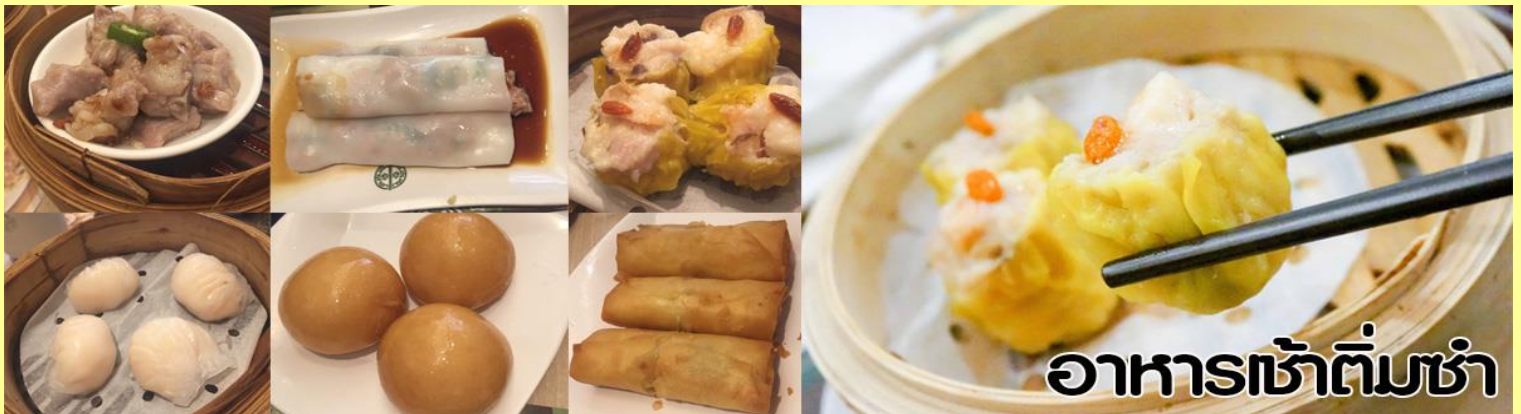
อาหารเช้าต้มซ่า