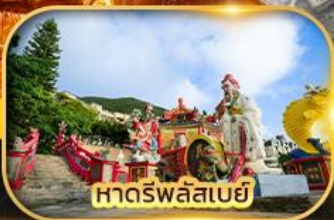
หาดรัพลัสเบย์