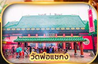
วัดโพธิ์เชกง