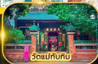
วัดแม่ทับทิม