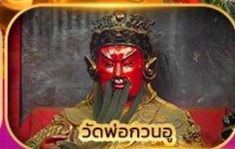
วัดพ่อกวนอู