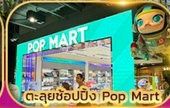
ตะลุยช้อปปิ้ง | Pop Mart