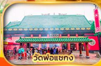
วัดพ้อแซง