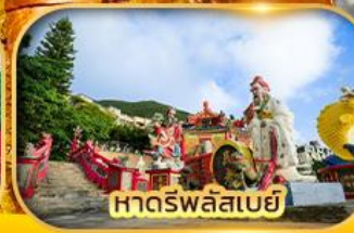
หาดรฬลลสเบย