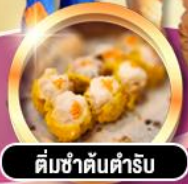
ต้มซ่าตันตำรับ