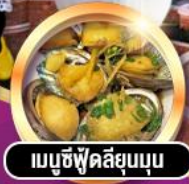
เมนูซีฟู้ดลิ้นขุน