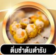
ติ่มซำคันตำรับ