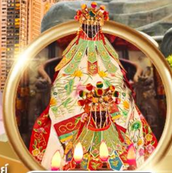
ฮิมเงินเจ้าแม่กวนอิมสองอ่า