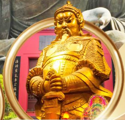
วัดเขangkหมิว