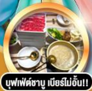
บุฟเฟ่ต์ชาบู เนิอร์ไม่อั้น!!