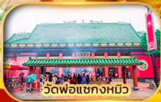
วัดพ่อแชกงหมิว